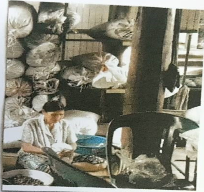
ที่ศูนย์ไทย กลุ่มวิสาหกิจชุมชนโรงปั่น ด้ายไหม ส.1