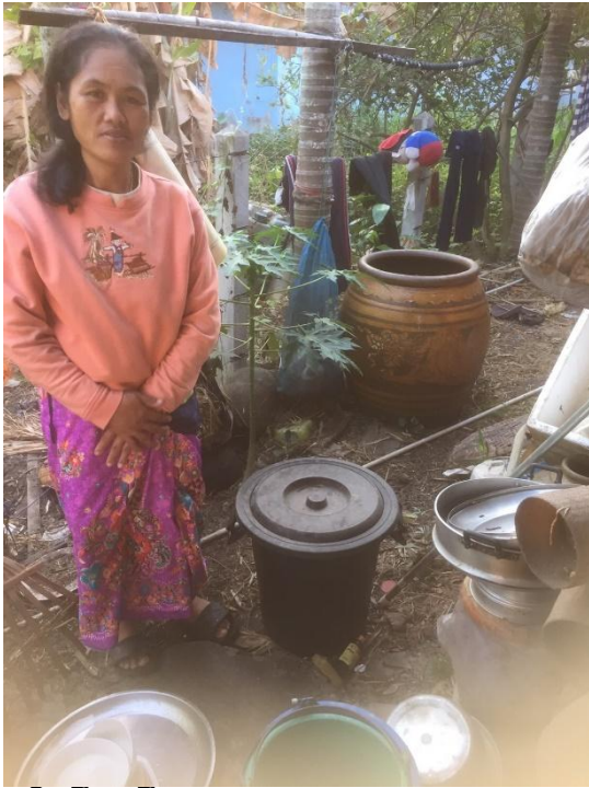
ครัวเรือนที่ ๑๖