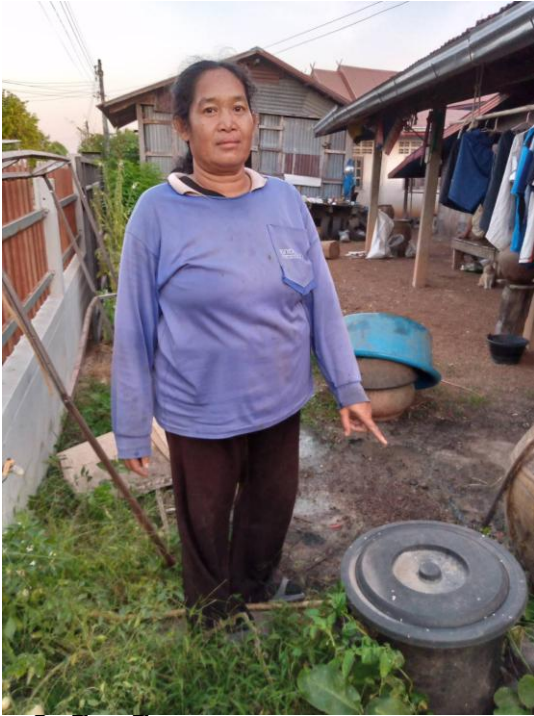
ครัวเรือนที่ ๑๐