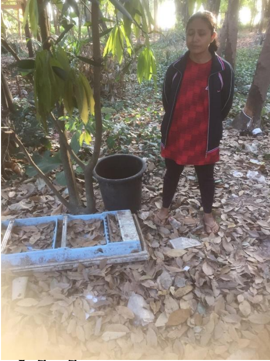
ครัวเรือนที่ ๑๒