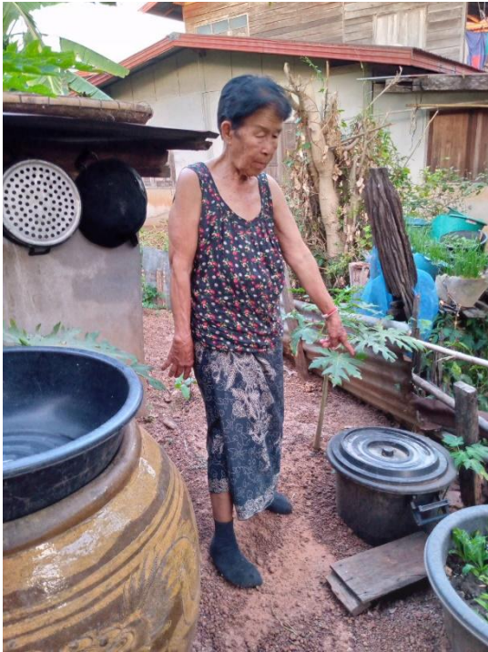
ครัวเรือนที่ ๖