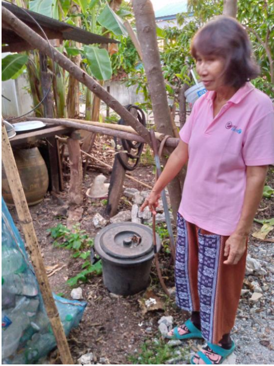
ครัวเรือนที่ ๘