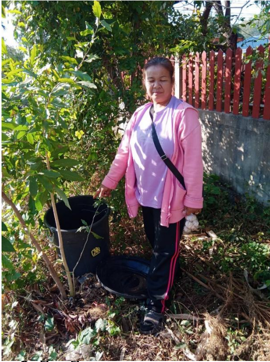
ครัวเรือนที่ ๒๖