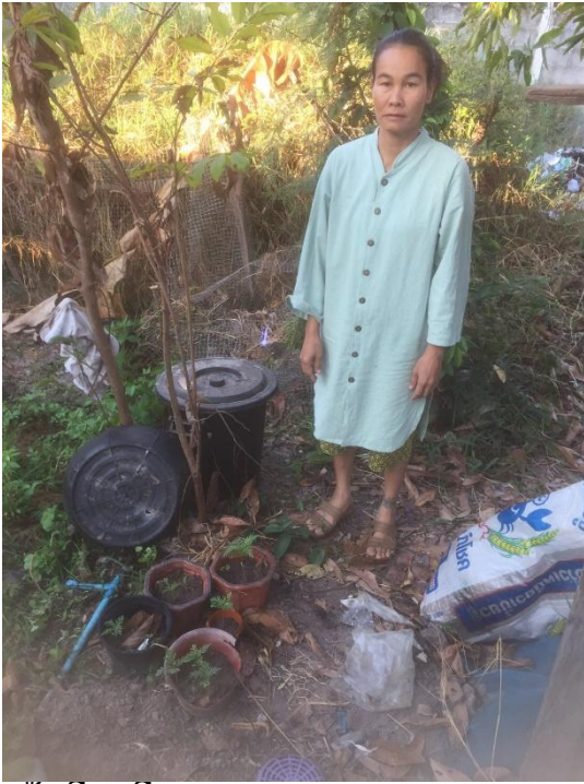
ครัวเรือนที่ ๑๘