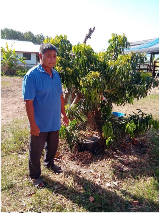
ครัวเรือนที่ ๒๒