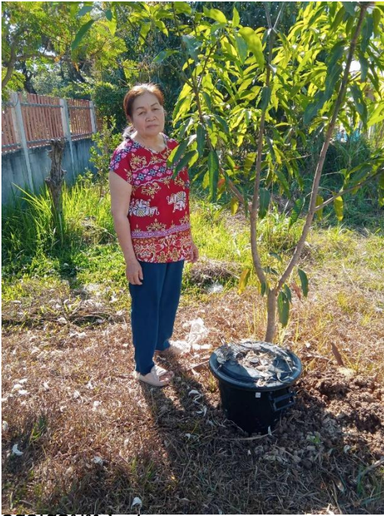
ครัวเรือนที่ ๒๔