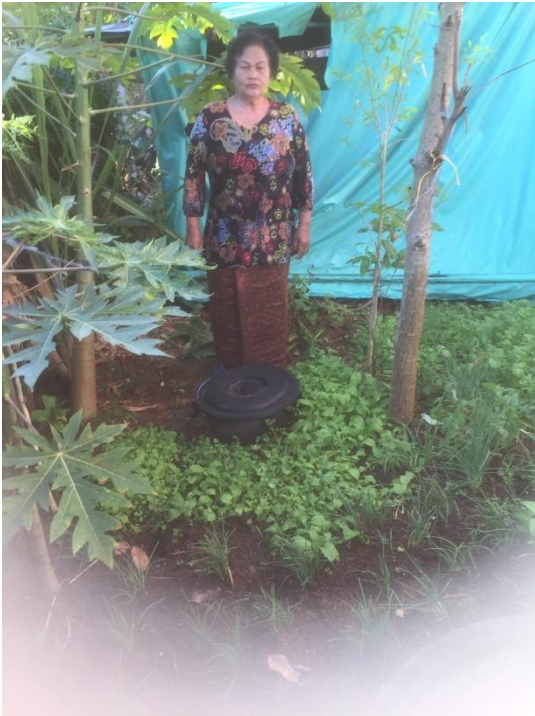
ครัวเรือนที่ ๑๔