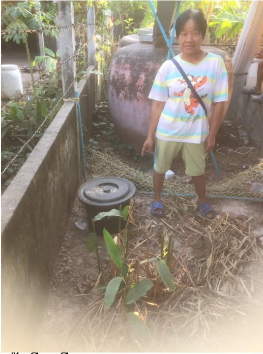
ครัวเรือนที่ ๒๐